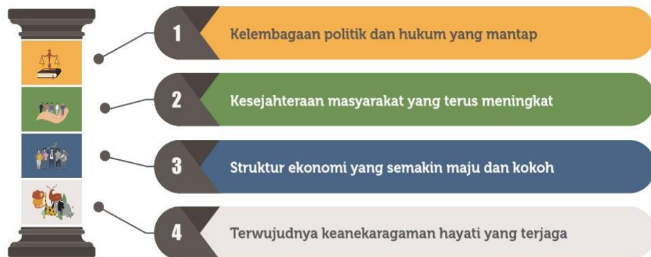
Gambar 3.1. Empat Pilar RPJMN IV tahun 2020 - 2024

Rencana Pembangunan Jangka Menengah Nasional (RPJMN) 2020-2024 merupakan tahapan terakhir dari Rencana Pembangunan Jangka Panjang Nasional (RPJPN) 2005-2025 sehingga menjadi sangat penting. Terdapat 4 (empat) pilar dari RPJMN ke IV tahun 2020-2024 yang merupakan amanat RPJPN 2005-2025 untuk mencapai tujuan utama dari rencana pembangunan nasional periode terakhir, yaitu: